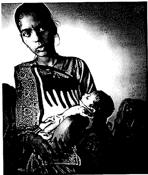
Oosterse Afrikaanse Kring

Zo lieve kijkbuiskindertjes, tot de volgende keer maar weer.